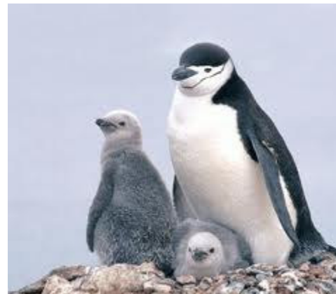
Fauna característica de la Antártida. El pingüino es un de los representantes más llamativos del mundo austral.

Según consigna el sitio electrónico http://www.explora.cl , “EXPLORA es un Programa Nacional de Educación No Formal en Ciencia y Tecnología, creado en 1995 por la Comisión Nacional de Investigación Científica y Tecnológica, CONICYT, Chile. Su misión, es contribuir a la creación de una cultura científica y tecnológica en la comunidad, particularmente en quienes se encuentran en edad escolar, mediante acciones de educación no formal