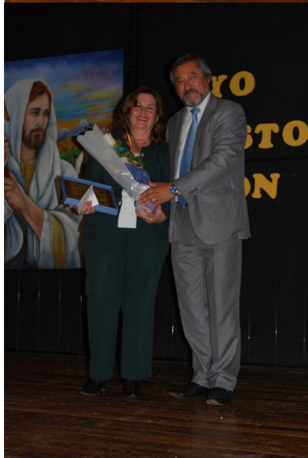
Un momento en el que el Rector distingue a una de las profesoras del Colegio.