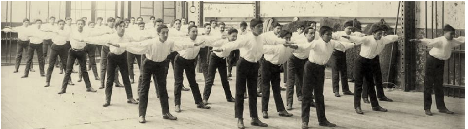
Una Clase de Educación Física

Con el paso de los años se fueron abriendo nuevas Escuelas Normales en: Iquique, Copiapó, Antofagasta, La Serena, Curicó, Talca, Victoria Chilán, Valdivia; Angol y Ancud.